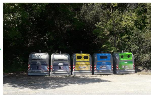
Evolution d'un point bacs en point d'apport volontaire à Ampus (Mobilier métal)