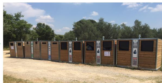
Évolution d'un point bacs en point d'apport volontaire à Sillans-la-Cascade (Mobilier bois)