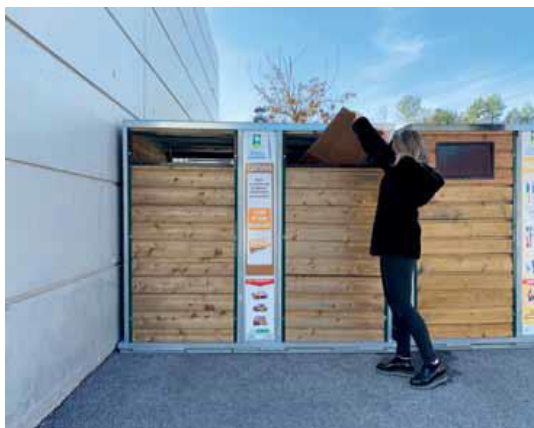
Colonnes de tri cartons en bois

L'implantation des nouvelles colonnes sont répartis sur les 23 communes, sur les PAV les plus performants.